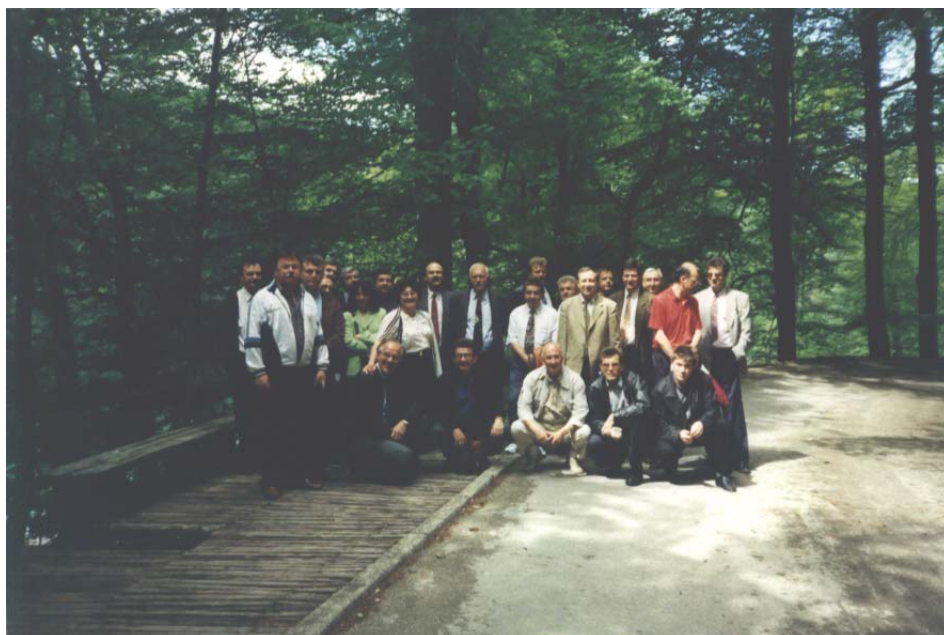
8. sjednica predsjedništva HGD-a 23. travnja 1997. na Plitvicama