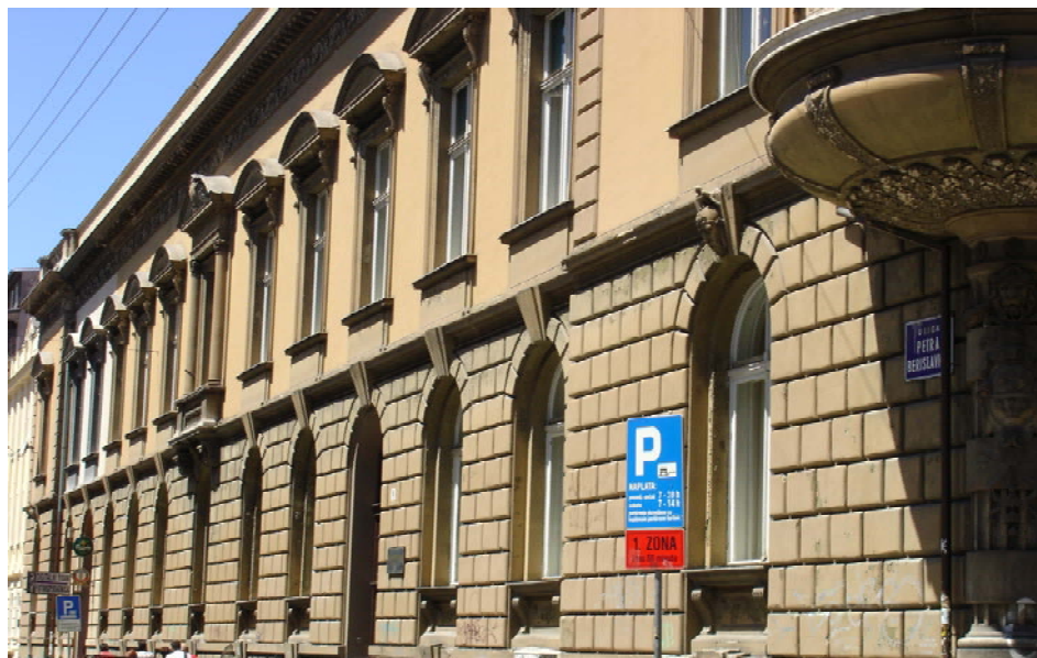
Zgrada Hrvatskoga inženjerskog saveza, Zagreb, Berislavićeva 6