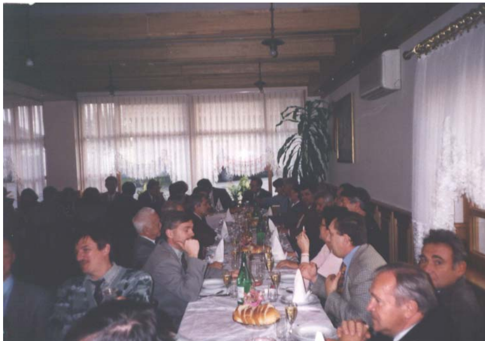
4. sjednica predsjedništva HGD-a 15. studenoga 1995. u Vivodini