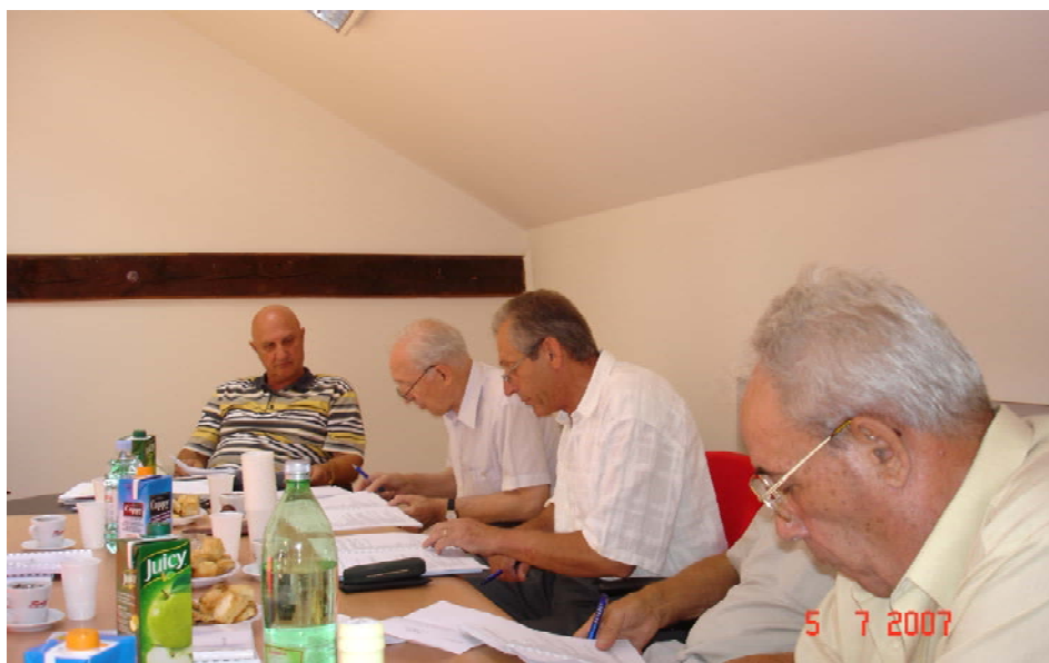
Sastanak Odbora za pripremu i organizaciju obilježavanja 55. obljetnice HGD-a