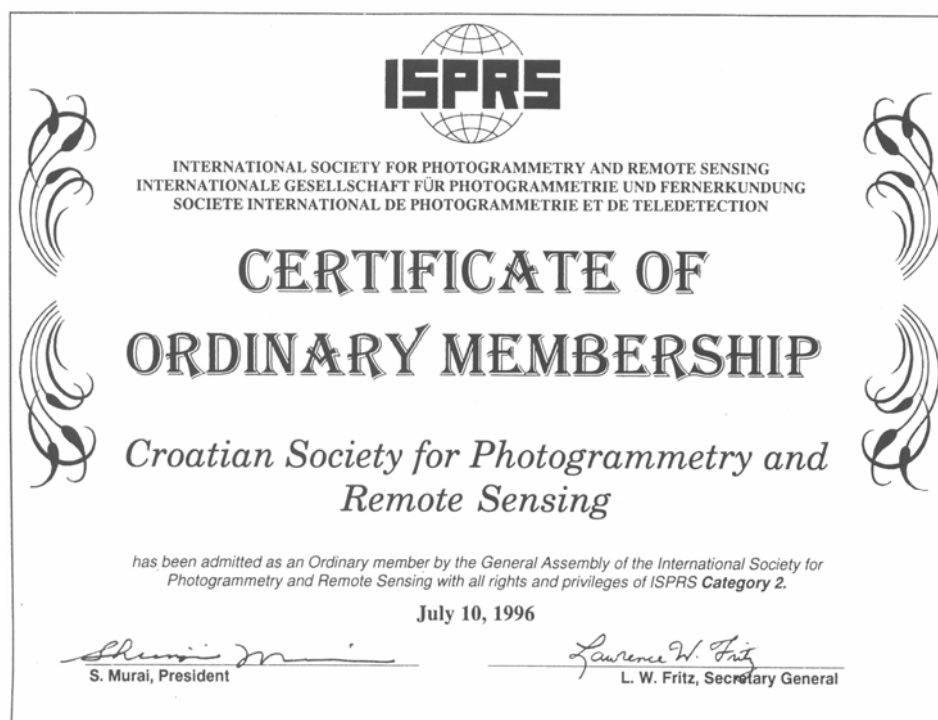
Dokument o primanju Sekcije za fotogrametriju i daljinska istraživanja HGD-a u ISPRS (Semak, Fiedler 1996)

Međunarodno društvo za fotogrametriju i daljinska istraživanja (International Society for Photogrammetry and Remote Sensing – ISPRS) sastoji se od organizacija koje su redoviti članovi i predstavljaju 94 zemlje, šest članova regionalnih asocijacija i 30 pridruženih članova. ISPRS je nevladina međunarodna organizacija posvećena razvijanju međunarodne suradnje u težnji unapređivanja fotogrametrije, daljinskih istraživanja, geoinformacijskih sustava i njihove primjene.