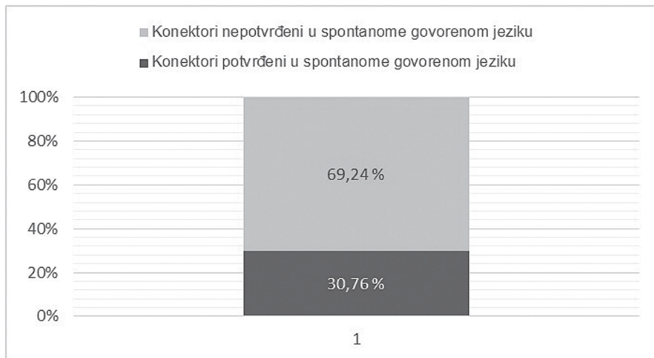
Slika 1. Postotni udio konektora iz pisanih izvora i onih koji su potvrđeni u uzorku spontanoga govorenog jezika

konektora, to jest jezičnih jedinica koje su prikupljene iz opisa hrvatskoga jezika te se primarno temelje na pisanim izvorima. Ukupan broj konektora iz opisa hrvatskoga jezika i onih koji se pojavljuju u spontanome govorenom jeziku prikazani su na Slici 1. Zastupljena su 44 konektora od ukupno 143 tražena oblika, što čini 30,76 %.