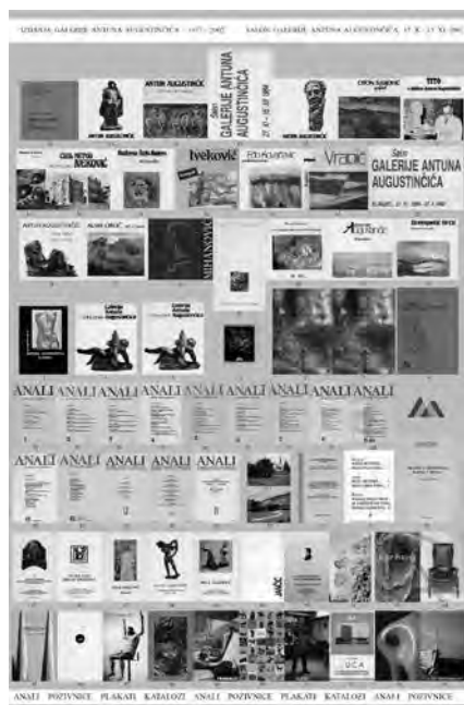
5. Naslovnica kataloga izložbe Izdanja Galerije Antuna Augustinčića: 1977 – 2002. , Klanjec, 2002.

Cover page of the catalogue of the exhibition entitled, Editions of Antun Augustinčić Gallery 1977-2002. Klanjec, 2002.