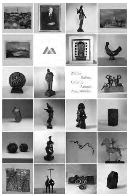
6. Naslovnica kataloga Zbirke Salona Galerije Antuna Augustinčića , Klanjec, 2004.

Cover page of the catalogue of the exhibition entitled, Editions of Antun Augustinčić Gallery 1977-2002. Klanjec, 2002.