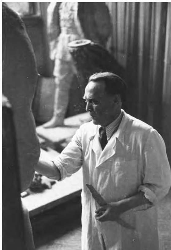
1. Antun Augustinčić pri radu u svom ateljeu. Zagreb, 1950-ih godina

Antun Augustinčić at work in his studio. Zagreb, 1950s (photo: T. Dabac, Antun Augustinčić Gallery Photograph Collection)