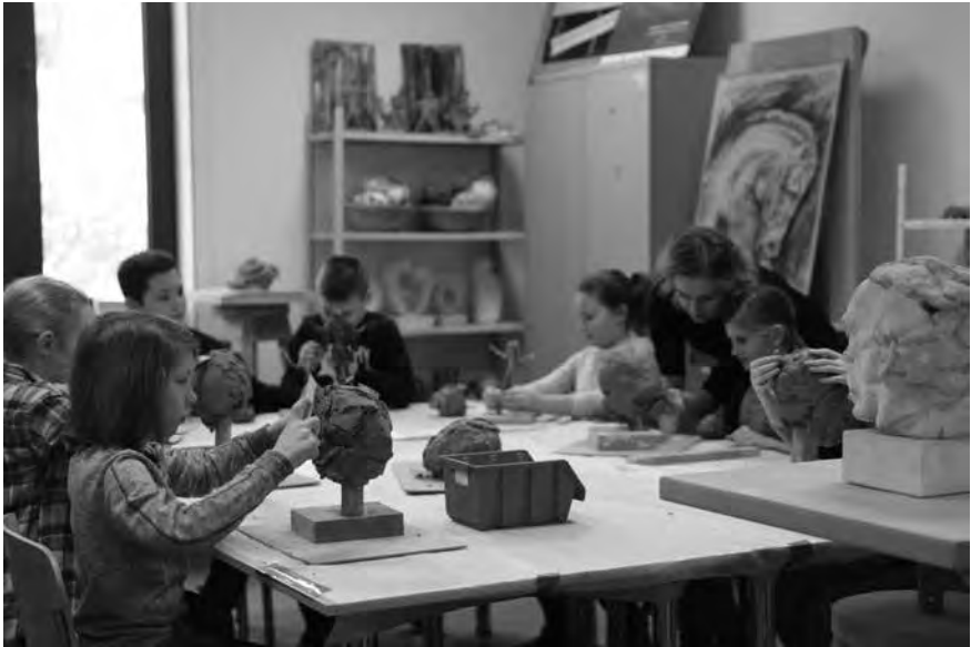
10. Likovna radionica u Studiju GAA, 2019.

Art workshop at GAA Studio, 2019