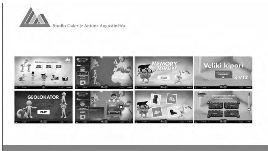
9. Edutainment aplikacije dostupne na interaktivnim kioscima.

Edutainment applications available at interactive kiosks