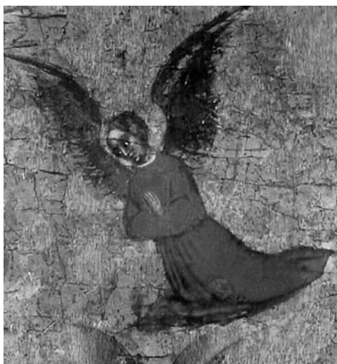
Blaž Jurjev, Bogorodica u ružičnjaku, detalj anđela, Muzej sakralne umjetnosti u Trogiru

Figura anđela sastavljena je od više spojenih dijelova. Posebno su izrađeni: glava, ruke, dlanovi, trup i donji dio lika s postamentom. Cvito Fisković je iznio hipotezu o ikonografskoj reinterpetaciji srebrne figure, smatrajući da je zamijenjena glava, prilagođen položaj ruku i dodana krila, naime da je lik sv. Lovre u odjeći đakona preoblikovan u anđela nosača relikvije. 41 Ugovor sklopljen 23. listopada 1446. godine s majstorom Tomom to osporava, precizno opisujući narudžbu i potvrđujući izvorni izgled relikvijara uobličenog prema tradiciji da je »sveta ruka angelskim načinom donesena«. 42