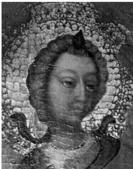
Blaž Jurjev, Detalj arhanđela Mihovila s poliptiha trogirskih dominikanaca

Na fino oblikovanom licu anđela s velikim zaobljenim plohama visokog čela i punih obraza ističu se izduženi nos i male tanke usnice. Detaljno su urezane lučno zasvedene obrve, a oči oblikovane sa stanjenim krajevima, velikim kopcima i naglašenim šarenicama. Ispod uvojaka kose samo vire ušne resice. Vrlo detaljno plastično oblikovani uvojci s blagim razdjeljkom i trokutastim pramenom na vrhu valovito uokviruju lice. Relativno veliki dlanovi izlažu i prikazuju svećevu relikviju u naknadno izrađenoj kutijici. Kapsela urešena rokoko oblicima nastala je 1756. godine kao i srebrna aureola sa spužolikim i školjkastim motivima. 44 Izdužena techa proširenih krajeva i uzdignute sredine urešena je motivima rokaja i florealnim ukrasima (41 x 12 x 8 cm). Na sredini su dvije glavice anđela nadvišene ružom, motivi oblaka i voluta dijelom su pozlaćeni, a na krajevima je vijenac cvijeća i voća.