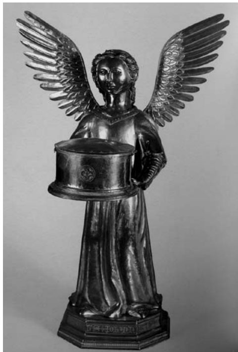
Anđeo s relikvijom sv. Andrije, katedrala u Veltralli (Viterbo)

Iako su dalmatinske crkvene riznice bile pune bogato ukrašenih brahijarija u gesti blagoslivljanja, u dragocjenim rukama nisu nužno bili ti dijelovi tijela. Jedan od sličnih primjera je ruka sv. Donata sa svečevom claviculom iz prve pol. 15. st. koja je pripadala zadarskoj katedrali. 57 Oblik precioznog pokrova u obliku ruke vjernicima je značio blagoslov, ozdravljenje i milost jer je sadržavao dio svečeva tijela.