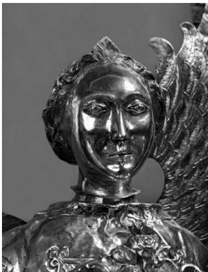
Glava anđela zlatara Tome Radoslavića

Kada je C. Fisković istakao razliku između lica i ruku anđela i njegove odjeće, zapravo je prepoznao specifičnost u kvaliteti srebra inkarnata i ruha, a upravo je to bilo uvjetovano narudžbom. Tekst ugovora potvrđuje da se ne radi o adaptaciji lika sv. Lovre u đakonskoj dalmatici već o anđelu nosaču moći sveca, koji je odjeven u đakonsko odnosno svećeničko ruho. Disproporcija između visine lika i dužine njegovih ruku uvjetovana je veličinom relikvije i srebrne teche koju je nosio.