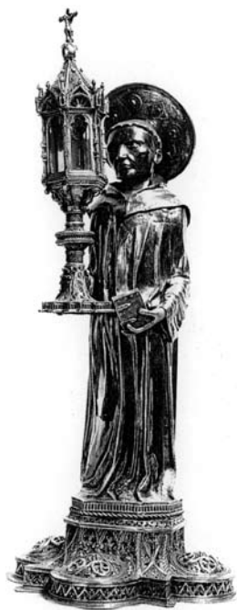
Moćnik prsta sv. Ante Padovanskog, Padova, Basilica del Santo, Tesoro delle reliquie