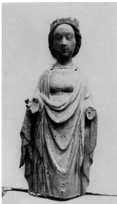
Blaž Jurjev, Lik sv. Katarine

Reljefni središnji lik sv. Katarine, s poliptiha iz crkve trogirskih dominikanaca, svojim hijeratskim stavom, s blago ispruženim rukama, fragilno opuštenim ravnima i ovalnim licem, mogao je utjecati na figuraciju majstora Tome.