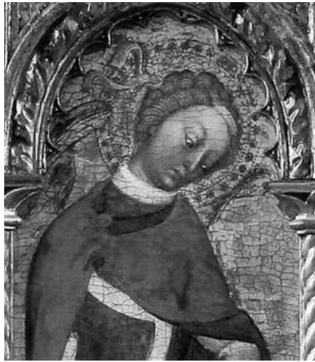
Blaž Jurjev, Arhanđel Mihovil s velikog poliptiha iz crkve sv. Ivana Krstitelja, Muzej sakralne umjetnosti u Trogiru

Iako nam nije poznat izvornik tog prijepisa doznajemo vrijedne podatke o izgledu temeljnih svetinja trogirске stolnice, a to su bista s dijelom lubanje sv. Ivana, ruka koju podržava anđel i starije ruke ukrašene filigranom iz kojih su kosti izvađene i poslije zamijenjene člancima prstiju.