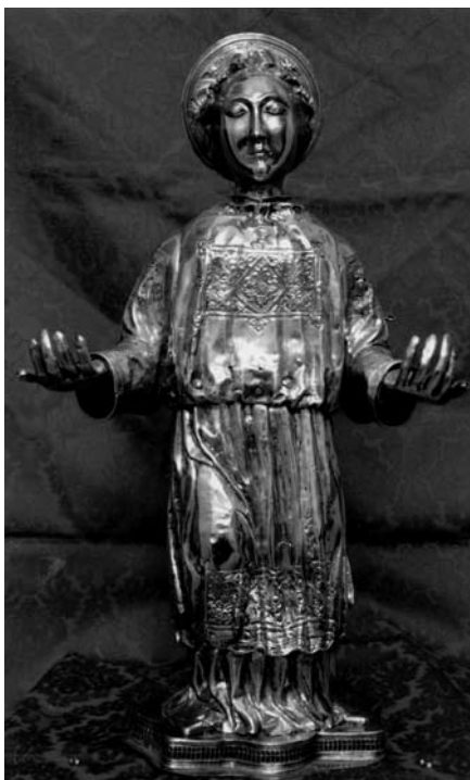
Toma Radoslavić, Figura anđela