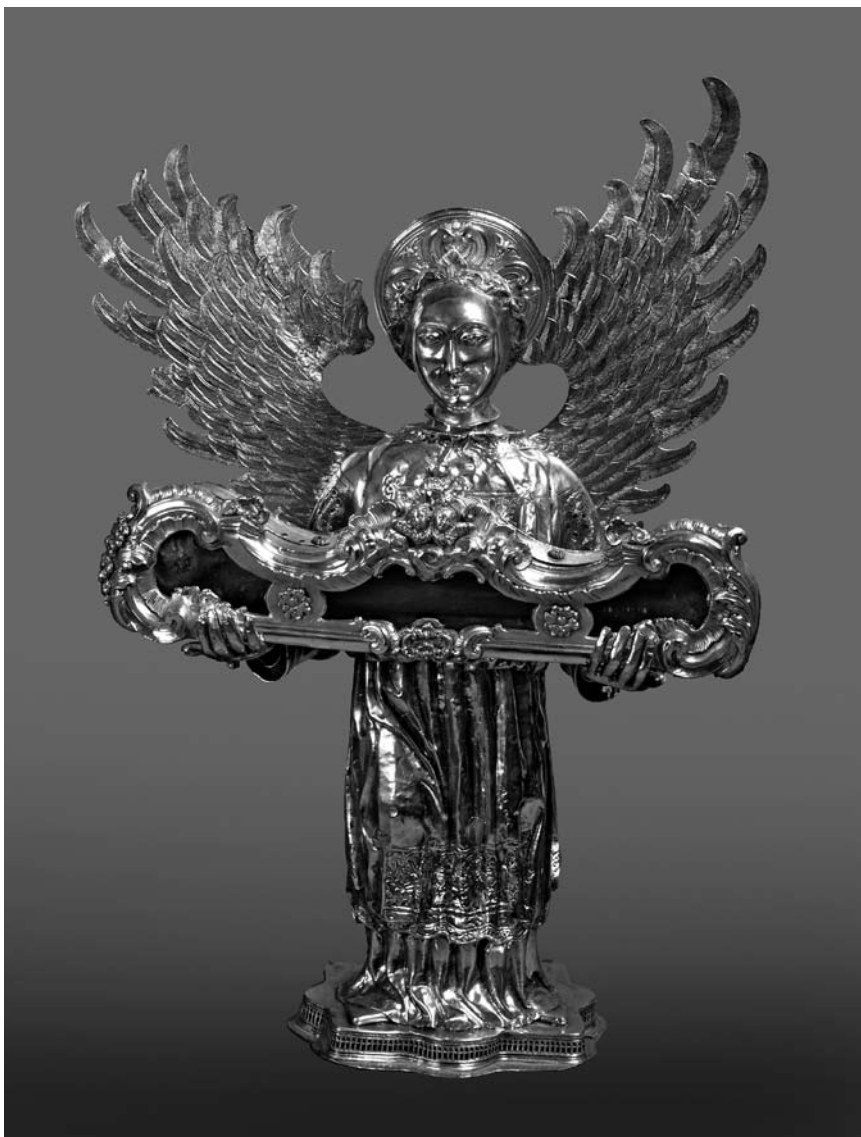
Toma Radoslavić, Srebrni anđeo s relikvijom ruke sv. Ivana Trogirskog, Riznica katedrale sv. Lovre u Trogiru

kružićima aplika se plastično odvaja od tkanine na koju je prišivena. Isti se motiv ponavlja na leđima kao i ispod ramena. Na sredini je romb s upisanim četverolatičnim cvijetom šiljatih latica i mrežasto ukrašenim tučkom. S obje strane romba po jedan je cvijet s pet polukružnih latica, a prazni prostor ispunjen je bogato oblikovanim lišćem. Na donjem je rubu misnice mnogo šira aplika s pet cvjetova i lišćem koje ide u suprotnim smjerovima. Iznad veza se izmjenjuju nabori te je vješto izveden florealni motiv u skraćenju. Na stražnjoj strani ponavlja se motiv