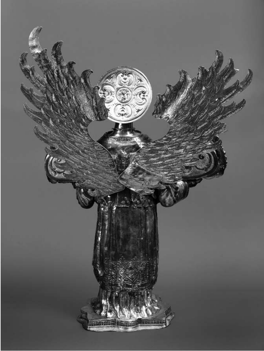
Toma Radoslavić, Leđa srebrnog anđela s krilima

romba sa središnjim cvijetom i četiri lista sa strana, a lateralno se veliki razgranati list usmjerava prema sredini. Rubom dalmatike teče uska traka intermitirajuće lozice koja se penje i po rubu proreza sa strane. Na završetku rukava je šira vrpca s urezanim lišćem i kružićima u pozadini.