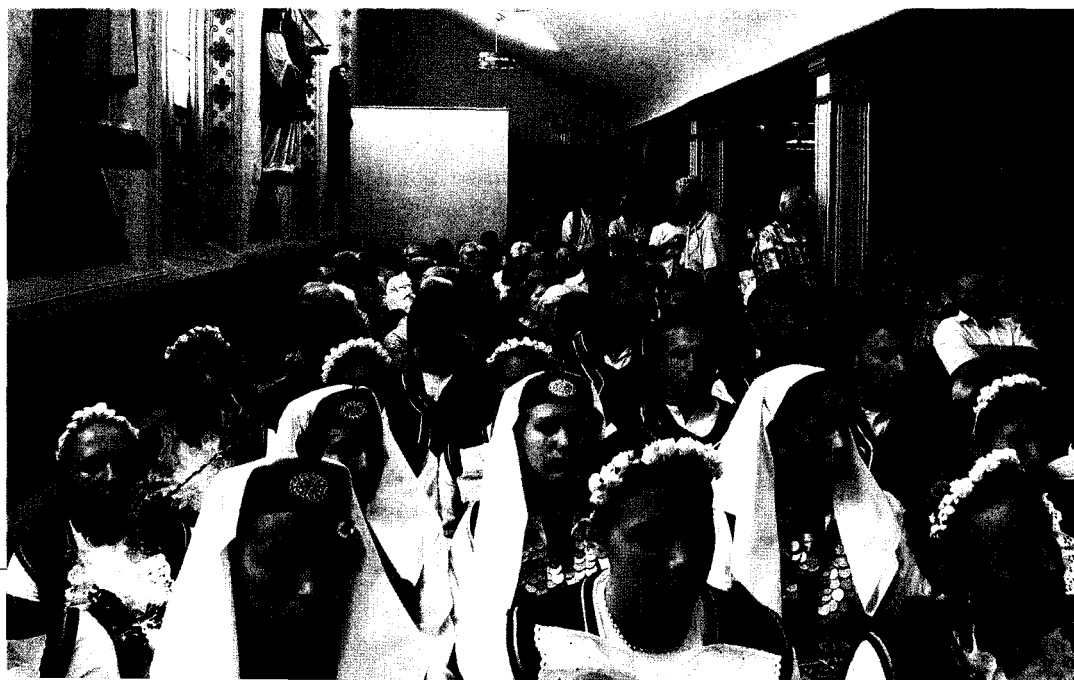
GOSPA SINJSKA 2007/2008

"Na mladima je da otkriju temelje starog samostana i stare crkve" u Cetini! Ova je riječ napisana prije pedeset godina u Vjesniku Provincije Presvetog Otkupitelja. Na nama je da barem isklešemo novu spomen-ploču i ovaj je put postavimo u Kuli koja se nalazi u starom mjestu Cetini. Samo povlaštenu od Boga dožive jubileje poput ovoga: 650. godišnjica od utemeljenja franjevačkog samostana, odvajkada glavnoga duhovnog i kulturnog središta Cetinske krajine. Jer "sjećajući se neprolaznih zasluga cetinskih franjevaca u radu za Boga i svoj hrvatski narod" - kako je točno prije pedeset godina uklesano na spomen-ploči - čuvamo korijene, rod i ispunjavamo živote i zavjete svojih preda.