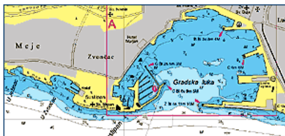
Slika 2. Gradska luka Splita, grada sjedišta Hrvatskog hidrografskog instituta - HHI

Organizirana hidrografska djelatnost u istočnom Jadranskom moru ( E-East ) danas se provodi djelovanjem Hrvatskog hidrografskog instituta iz Splita (Slika 2.), Hidrografskog instituta Mornarice iz Lepetana (Crna Gora), Albanian Hydrographic Service iz Drača (Albanija) u Jadranskom moru ( W-West ) u djelatnosti Direttore dell'Istituto Idrografico Della Marina iz Genove (Italija).