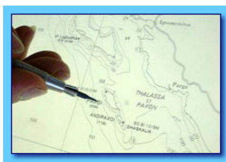
Slika 1. Primjer pomorske karte

U baštinu pomorskog nasljeđa može se svrstati organizirana djelatnost hidrografskih organizacija. Međunarodna hidrografska organizacija ( International Hydrographic Organization – IHO ) sa sjedištem u Monaku krovna je organizacija svih zemalja članica. Hidrografsku djelatnost različitih zemalja provode organizacije različitih naziva npr. hidrografski instituti, odjeli ili uredi. U radu se kao opća odrednica nacionalnih hidrografskih organizacija koristi odrednica hidrografska organizacija. One u redovitoj djelatnosti proizvode pomorske karte i navigacijske publikacije. (Slika 1.)