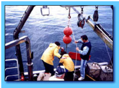
Slika 3. Radni postupci u hidrografskoj izmjeri