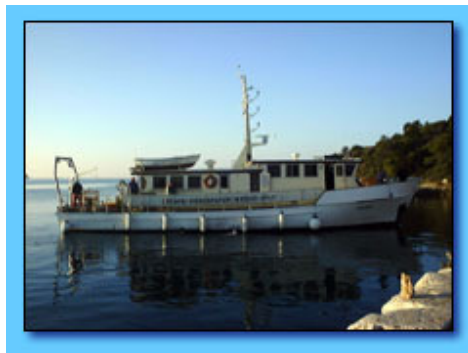
Slika 4. Istraživački brod „HIDRA“

Slikom 5 [1] prikazuju se godine osnivanja raznih hidrografskih organizacija uglednih pomorskih zemalja. U usporedbi drugih sa organiziranom hidrografskom djelatnošću na Jadranu zaključuje se da se Hrvatski hidrografski institut svrstava u najstarije hidrografske organizacije svijeta i drži se vrijednim spomenuti važnu obljetnicu 200 godina organizirane hidrografske djelatnosti na Jadranu.