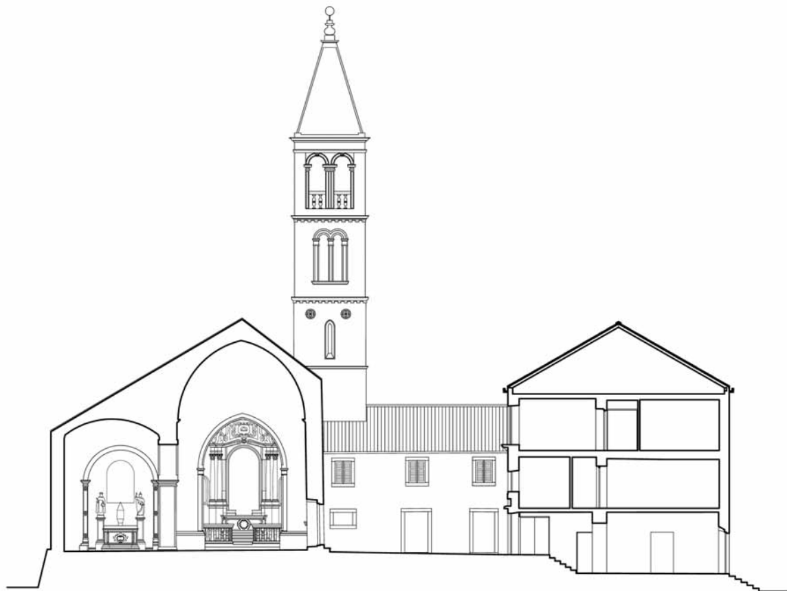
PRESJEK CRKVE I SAMOSTANA