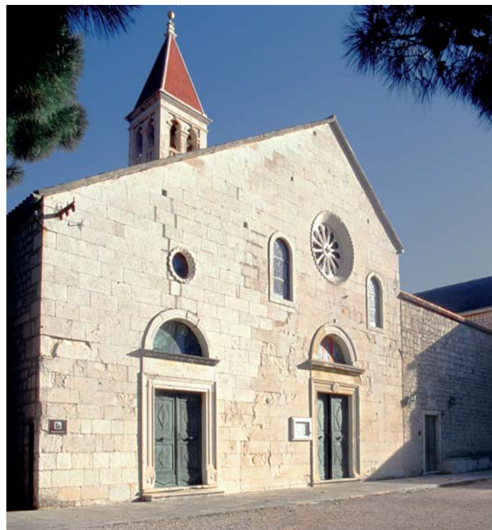
Zapadno pročelje sv. Marije Milosne

Uz sjeverni zid crkve uređene su kapele kao i kod samostanske crkve u Starome Gradu na Hvaru. Za jednu od njih, koja se gradila u razdoblju od 1571. do 1581. godine, bio je napravljen nacrt. Vjerojatno se radi o kapeli presvetog Ružarija podignutoj uz već postojeću, koju je u 15.