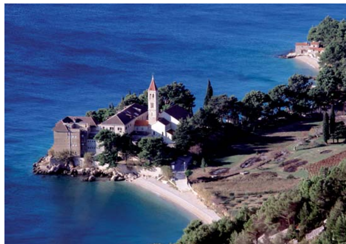
Bol, položaj crkve i samostan sv. Dominika na obali

Samostan je utemeljen na južnoj obali otoka Brača, u starome naselju koje se nekoliko godina prije dolaska dominikanaca odvojilo od