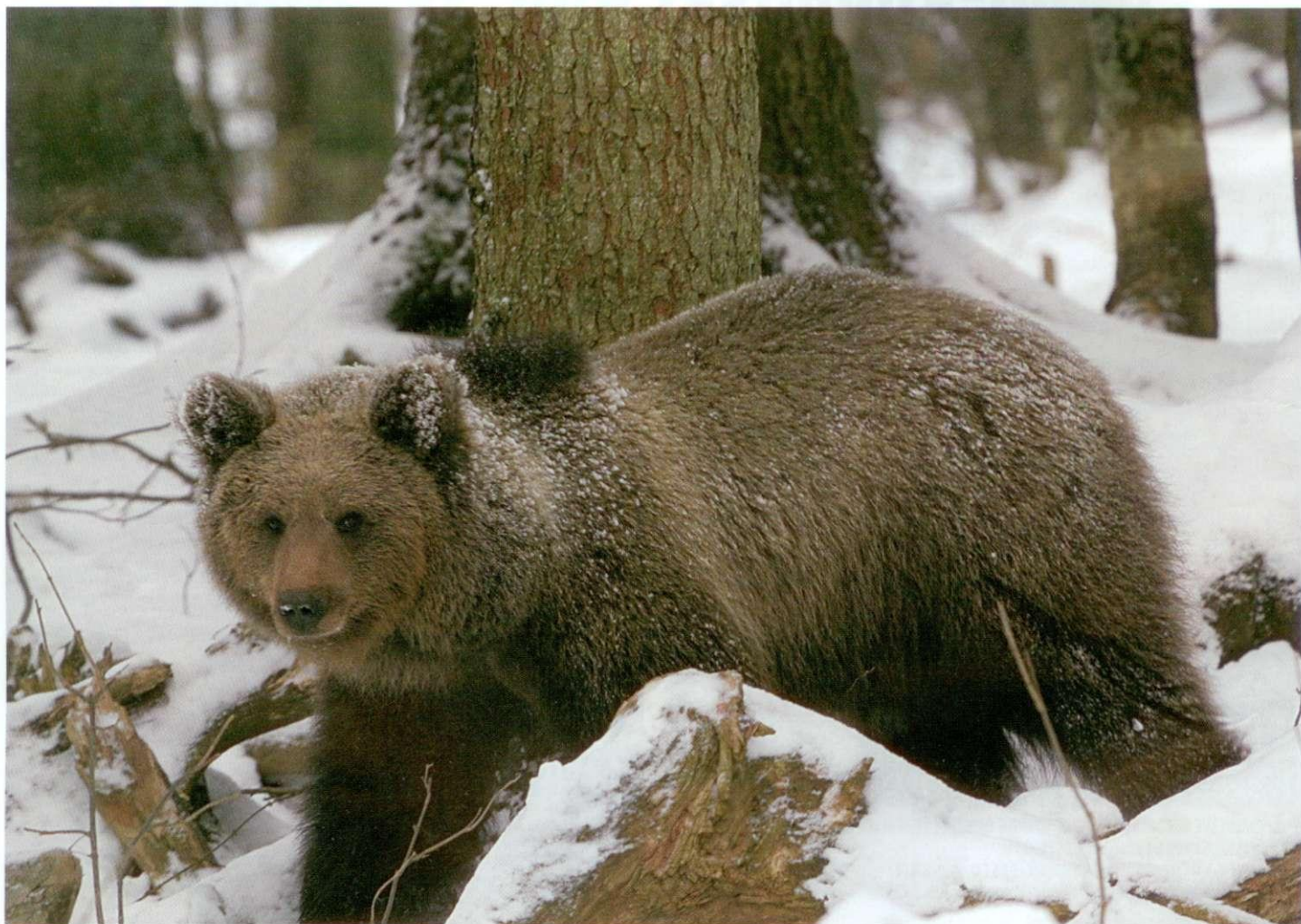
Lovoovlaštenici koji su dobili pravo odstrjela medvjeda moraju ga i ostvariti

kulteta u svojoj prezentaciji predstavio metode utvrđivanja brojnosti populacije. Prof. dr. Huber je također predstavio rezultate opsežnog istraživanja brojnosti smeđeg medvjeda u Hrvatskoj pomoću metoda molekularne biologije. Metoda se sastoji od izolacije DNA iz tkiva odstrijeljenih medvjeda te iz izmeta prikupljenih na dva područja u Gorskom kotaru i jednom u Lici. Pomoću DNA identificirane su različite jedinke, te je statističkim metoda- ma utvrđeno da u Hrvatskoj živi