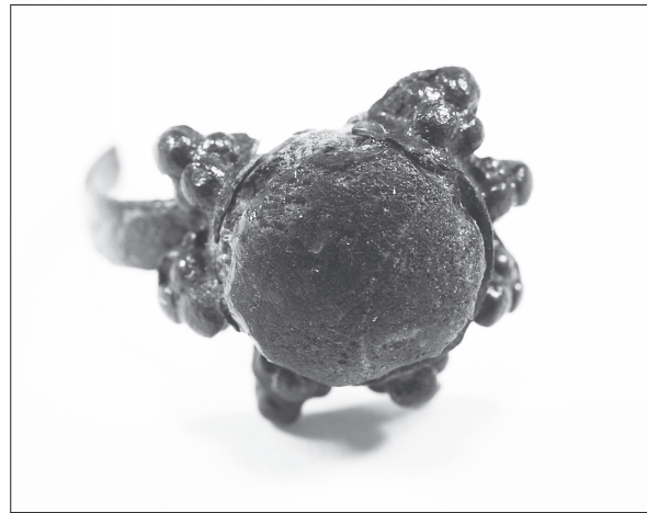
Sl. 2. Srebrni prsten ukrašen granulacijom i s umetnutim plavim kamenom

Grob 73 nalazi se u južnoj prostoriji, u sjeveroistočnom uglu i presječen je istočnim zidom objekta. Zapuna je uočena kao tvrdi zelenkasti pijesak (2YR 4/2 olive brown) na visini 119,64 m. Grobna raka je bila ukopana u SJ 003. Dno rake je na visini 119,47 m. Kostur je bio očuvan samo u gornjem dijelu (glava, lopatice, rebra i prsni kralješci), ostatak kostura je