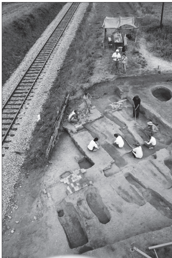
Sl. 1. Pogled iz zraka na površinu istraženu 2008. godine