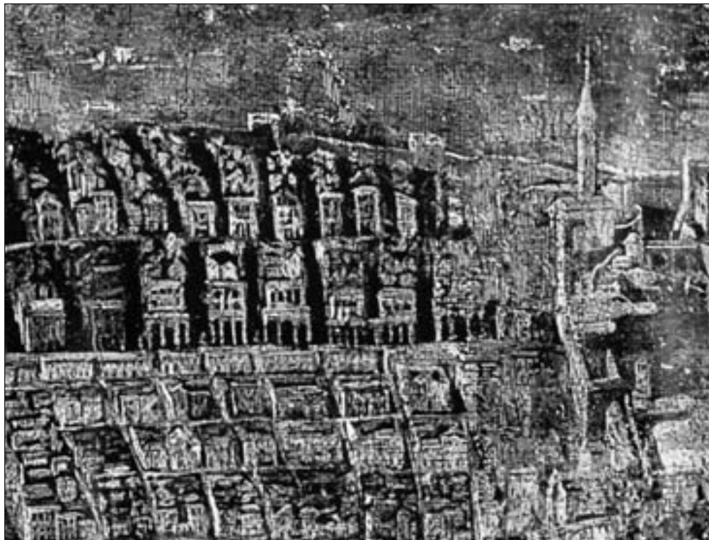
Općinske kuće zapadno od Sponze, detalj prikaza Dubrovnik na slici A. de Bellisa "Bogorodica u slavi sa sv. Vlahom i sv. Franjom Asiškim" u Dominikanskom samostanu

s po četiri kuće i osam dućana/radionica u prizemlju. Dvije posljednje izgrađene općinske kuće, na zapadnoj strani Boškovićeve, u prizemljima nisu imale po dva dućana, nego po jedan prostor namijenjen skladištenju trgovačke robe ( magazeno, stragno ).