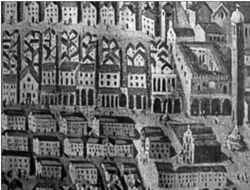
Općinske kuće zapadno od Sponze, detalj kopije vedute u Franjevačkom samostanu

Place) prostori u prizemljima (dućani) i prostori na katovima (kuće) nisu morali imati istog najmoprimca.