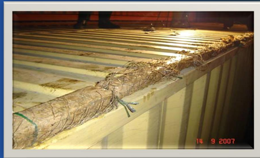
Kokain skriven u konstrukciji kontejnera, Rijeka 2007.