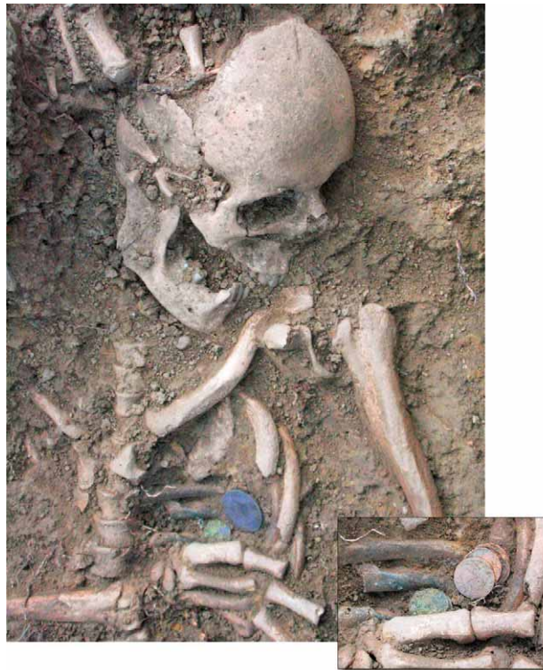
Sl. 3 – Nalazna situacija novca u Grobu 74.