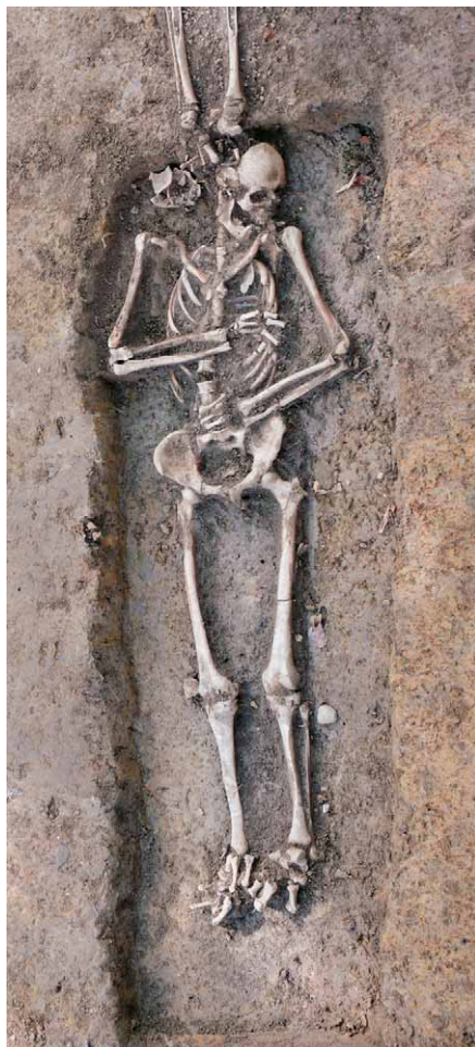
Sl. 2 – Grob 74.