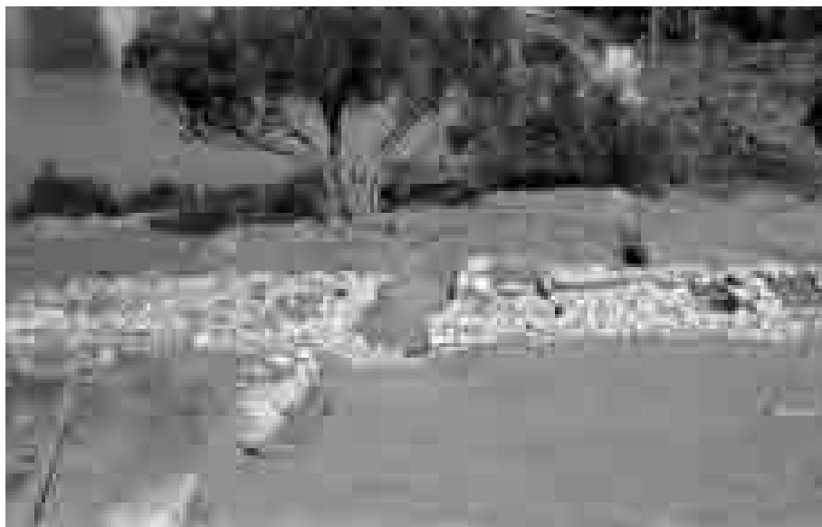
Koločep 1969., pogled s ruba iskopa na prostorije I i II.