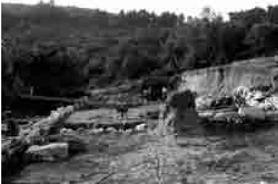
Koločep 1969., pogled iz prostorije I u prostoriju II.