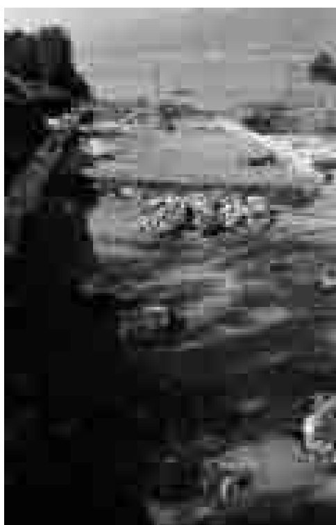
Koločep 1969., pogled na prostorije I i II (prema NW).