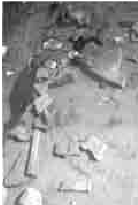
Koločep 1969., dio iskopanih ulomaka tegula i poklopaca amfora.