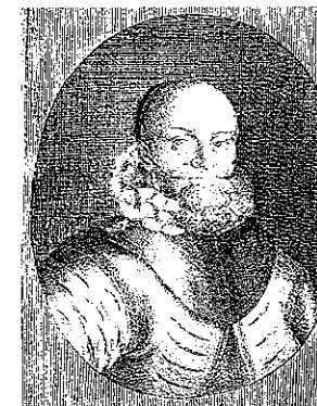
Veit von Hallegg.

Veit von Hallegg zu Razenegg bio je jedan od najuglednijih zapovjednika na Hrvatsko-Slavonskoj krajini u 16. stoljeću. Za razliku od Globizera, izvori ga uvijek spominju u radnom okružju, na važnim zadacima i u najboljem svjetlu bez obzira na složenu dužnost koju je obavljao. Uživao je izuzetan ugled i doživio mnogo pohvala među lokalnim plemstvom. Od 1554. do 1558. godine, bio je zapovjednik izravno podređen glavnom zapovjedniku Hrvatske i Slavonske krajine. Zatim je od 1559. do 1568. bio zamjenik zapovjednika Slavonske krajine, a od 1568. pa do 1589. godine glavni zapovjednik Slavonske krajine. Umro je 15. travnja 1589. godine, u 62. godini, nakon 35 godina obnašanja najviših službi. 26 O njegovu privatnom životu zasad znademo malo. Napominjemo da se godine 1577. u križevačkoj posadi spominje Georg von Hallegg, moguće Veitov sin, s prilično visokom mjesečnom plaćom od 12 guldena koja je odgovarala prosječnoj plaći nekog Burggrafa i bila znatno viša od 10 guldena mjesečno koje su obično dobivale haramijske vojvode. 27