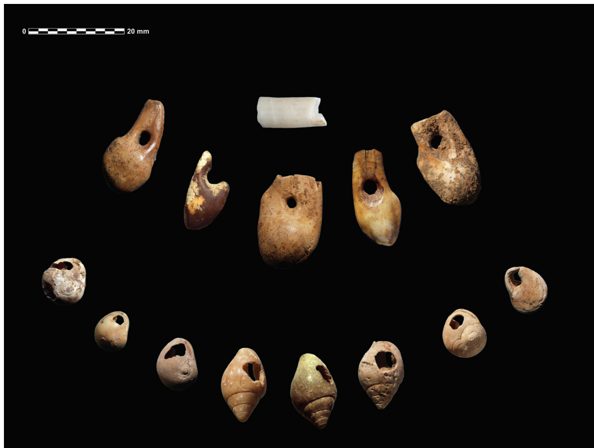
Sl. 2. Nakit od životinjskih zuba i morskih puževa.