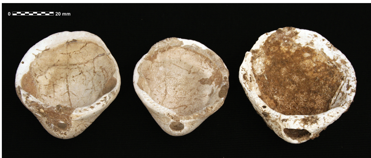
Sl. 4. Školjke s rupom na zatku.

Fig. 3. A detail of a perforated tooth with tool traces.