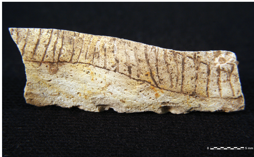
Sl. 5. Rožnjački gomolj s urezima (foto: M. Parica). Fig. 5. Chert nodule with incisions (photo: M. Parica).