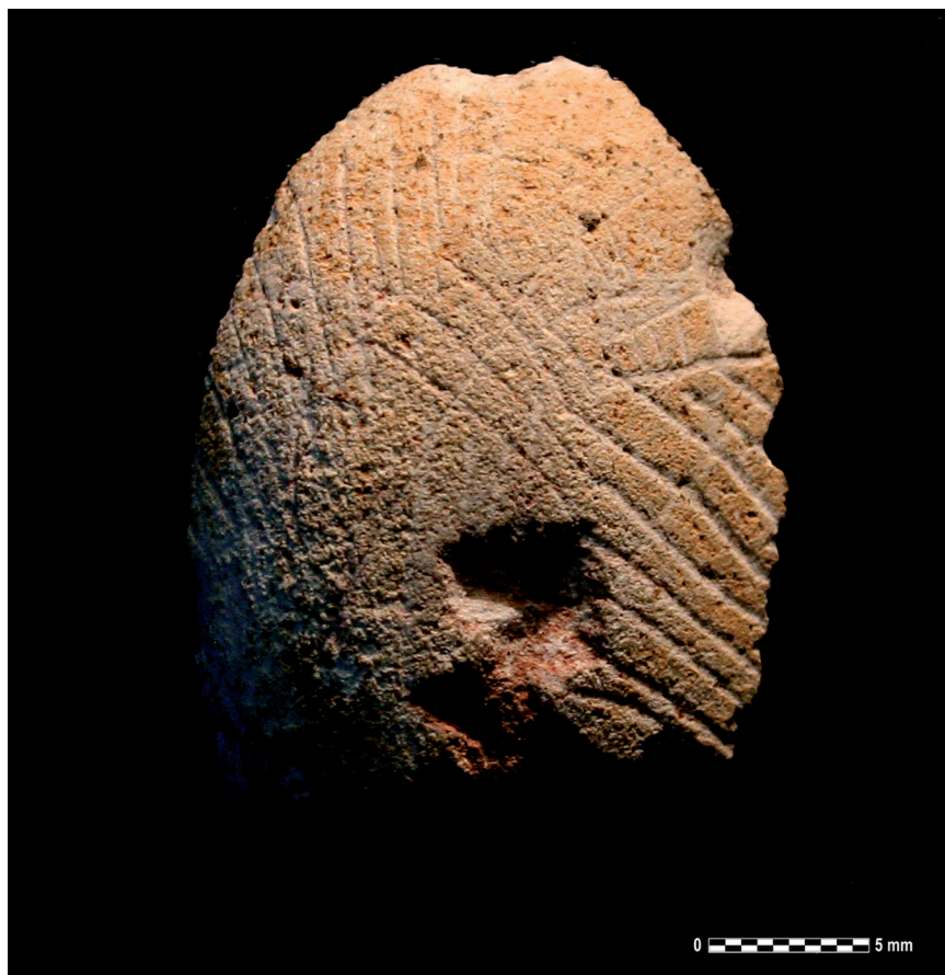
Sl. 6. Rožnjački gomolj s urezima. Fig. 6. Chert nodule with incisions.