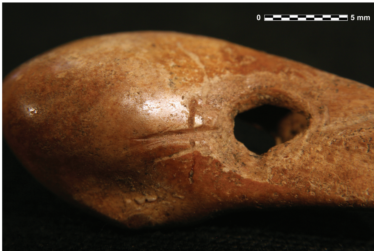
Sl. 3. Detalj probušenog zuba s tragovima alata.

Fig. 3. A detail of a perforated tooth with tool traces.