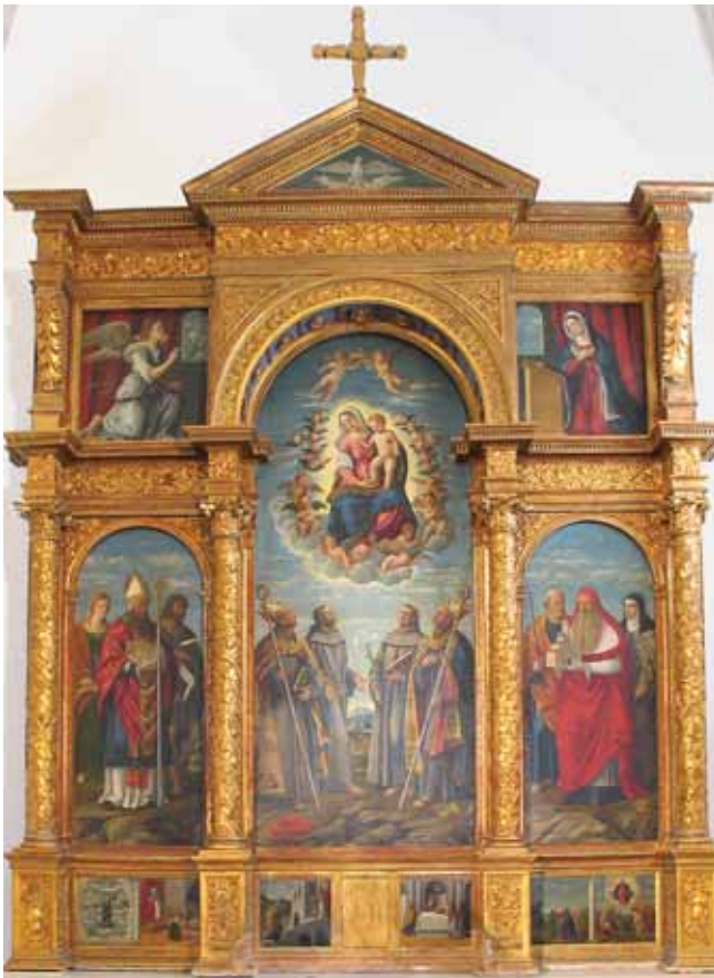
4. Girolamo da Santa Croce, poliptih glavnog oltara franjevačke crkve Navještenja Marijina, Košljun Girolamo da Santa Croce, polyptych of the main altar of the Franciscan Church of Annunciation, Košljun

su krupnije od figura sv. Jurja i sv. Mihovila. Osim toga, naslikani pejzaž u pozadini tih likova također se razlikuje. Nadalje, dimenzije su četiriju dasaka slične, ali nisu iste. One na kojima su naslikani sv. Franjo Asiški i sv. Sebastijan duge su 138 cm, a širina im varira od 51,6 do 52 cm, dok su dimenzije dasaka na kojima su sv. Mihovil i sv. Juraj dužine 137 cm, a širina im varira od 53,3 do 53,5 cm.