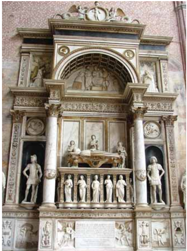
5. Tullio i Antonio Lombardo, grobnica dužda Andree Vendramina, SS Giovanni e Paolo, Venecija Tullio and Antonio Lombardo, the Doge Andrea Vendramin Tomb, SS Giovanni e Paolo, Venice

Vjerujem da bi jedan poliptih bio onaj sv. Roka. Taj je poliptih, po mojem mišljenju, u središnjoj osi imao sliku sv. Roka, s lijeve strane sv. Franju Asiškog, a zdesna sv. Sebastijana. Iznad bočnih slika, s lijeve i desne strane po svoj je prilici bio prizor Navještenja. Na takvu hipotezu upućuje i uobičajeno rješenje kojem su pribjegavali majstori ublažavajući razdiobu između slika istoga kata poliptiha. Objedinjujući elementi su impostacija likova; obojica bočnih svetaca donjega kata tijelima su okrenuta prema središnjoj figuri i ista je poveznica linije krajolika u pozadini tih naslikanih likova (sl. 3.). U prilog toj hipotezi govori opis jednog oltara što ga je 1773. godine zabilježio Ivan Marija Matijašević u franjevačkoj crkvi Rođenja Marijina koju naziva sv. Marija od Špilice: »Od desne strane glavnog oltara prema ljetnom zapadu je oltar sv. Roka, koji je u sredini. S jedne svečeve strane, brižno naslikani su sv. Dijego ispovjednik i sv. Sebastijan mučenik.« 13 Matijašević je očito zamijenio sv. Dijega odnosno sv. Didaka (franjevca kojega se također slika s križem u ruci)