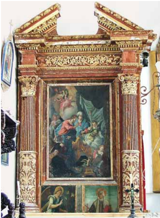
1. Oltar smrti sv. Josipa, crkva Rođenja Blažene Djevice Marije, Lopud Altar of St Joseph's death, the Church of the Nativity of the Blessed Virgin Mary, Lopud

poliptiha skicirao je Davor Domančić u svom dnevniku s terena godine 1964. kada su sve slike preuzete na restauraciju. 10 U tom neobjavljenom rukopisu, koji se čuva u arhivu Konzervatorskog odjela u Splitu, Domančić je iznio mišljenje da poliptih potječe iz sjeverne kapele u crkvi Gospe od Šunja na Lopudu (sl. 2.). 11