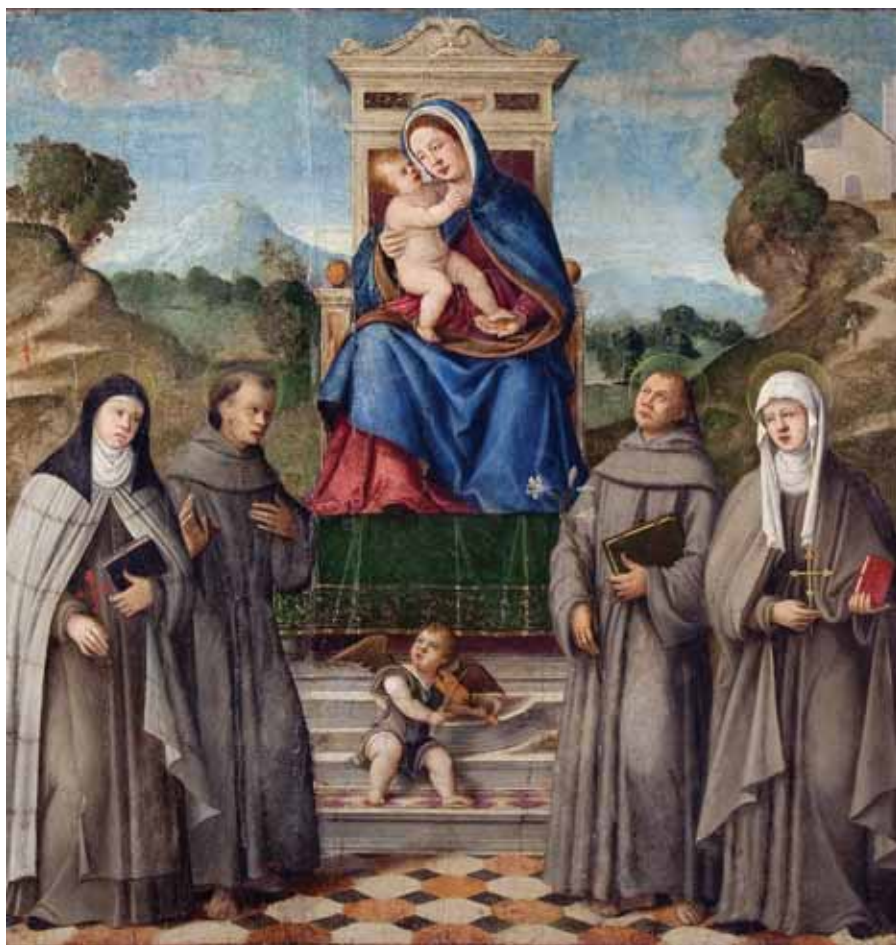
8. Girolamo da Santa Croce, Sacra Conversazione , ubikacija nepoznata Girolamo da Santa Croce, Sacra Conversazione, location unknown

ciji otoka Lopuda spominje četiri crkve koje su po Lisičaru pripadale trećoretkinjama. To su: crkva sv. Katarine, crkva sv. Ivana, crkva Gospe od Napuča i crkva presv. Trojstva (uz koju navodi da su po tradiciji bile benediktinke). Također je zanimljivo da su se koludrice iz samostana Gospe od Napuča pokapale u crkvi Rođenja Blažene Djevice Marije. 28