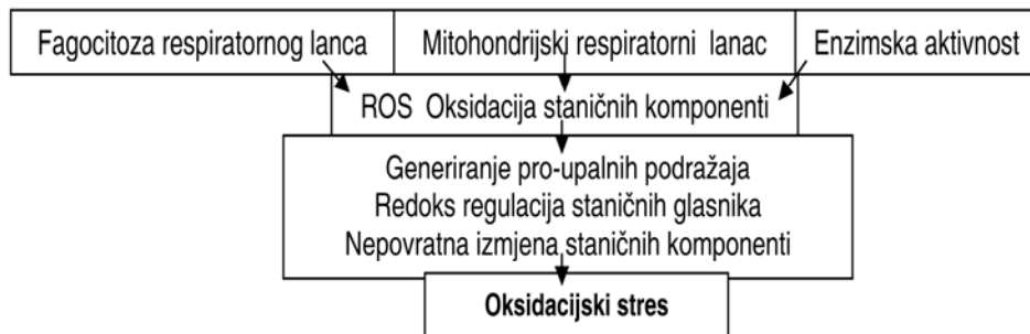
Shema 1. – FIZIOLOŠKE AKTIVNOSTI STANICE KOJA DOVODE DO OKSIDACIJSKOG STRESA (Kirschvink i Lekeux, 2002) Scheme 1. – PHYSIOLOGICAL CELLS ACTIVITIES THAT LEAD TO OXIDATIVE STRESS (Kirschvink and Lekeux, 2002)