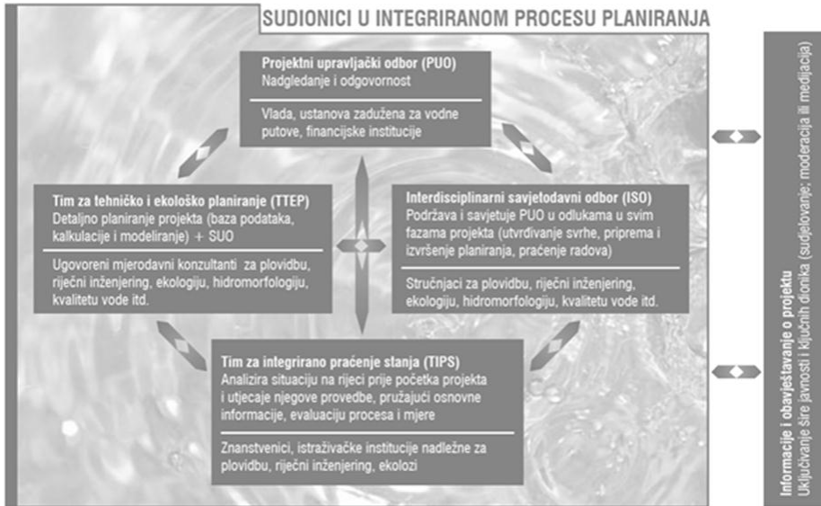
Slika 1. Shema integralnog procesa planiranja