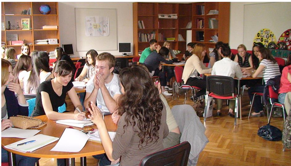
Slika 1. Učionica za nastavu pedagogije

Učionica je prilagođena suradničkom učenju studenata, čemu posebno pridonose okrugli stolovi (slika 1).