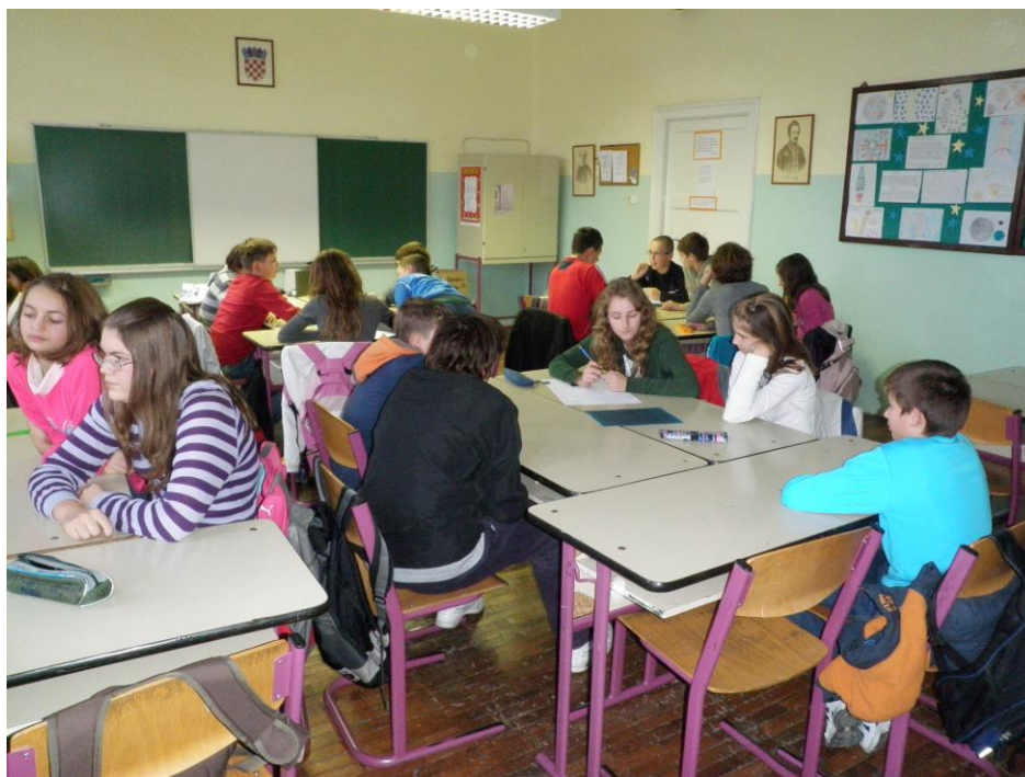
Slika 1: Suradničko učenje

Učenici su bili raspoređeni u skupine iste veličine kao i na prvom satu. Nastavnica je pripremila prijenosno računalo i projektor na kojemu je prikazala snimke poznatijih istražitelja i likova iz kriminalističkih filmova. Snimke su bile popraćene glazbom iz istoimenih filmova, a svrha uvodne, motivacijske aktivnosti bila je da učenici pogode o kojim je likovima riječ, nakon čega je nastavnica povela razgovor u likovima u kriminalističkim filmovima.