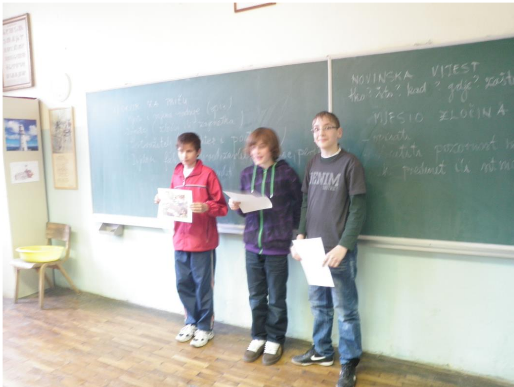
Slika 2: Predstavljanje jedne od skupina

Nakon sata ostala sam razgovarati s nastavnicom i iskreno sam joj rekla koliko sam iznenađena s njezinom kreativnošću. Razgovarale smo i o planovima za sljedeći sat na kojem ću prisustvovati. Pitala sam ju za jednog učenika kojeg sam primijetila tijekom sata, a djelovao je povučeno i samozatajno. Nastavnica mi je tad prvi puta rekla kako u svom razredu ima i učenika s posebnim potrebama. Smatram kako bi bilo vrlo poželjno pronaći način da se i takvi učenici uključe u rad razreda, socijaliziraju se i uključe u društvo.