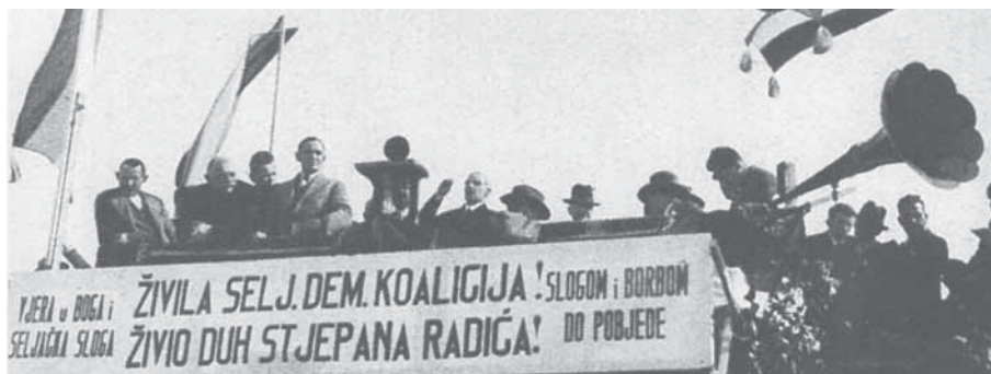
Govornička tribina: govori dr. Vladko Maček (21. listopada 1928, Sisak)

ća, koji je stvoren i za njegova života i poslije njegove »mučeničke« smrti. I njegov je nasljednik na vodstvu stranke Vladko Maček s vremenom postao snažna politička figura oko koje se počeo u 30-im godinama XX. stoljeća stvarati ponajprije »seljački« kult ličnosti. Upravo je njegovo izdizanje nad »običnim smrtnicima« u svrhu nacionalne homogenizacije hrvatskog naroda unutar seljačkog pokreta HSS-a tema ovog rada.