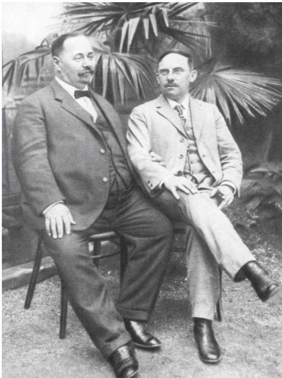
Stjepan Radić i dr. Vladko Maček u Seljačkom domu