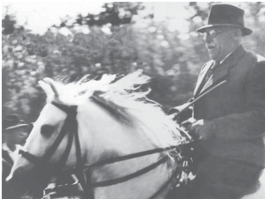
Dr. Vladko Maček prije ubičenja (ujesen 1941, Kupinec)