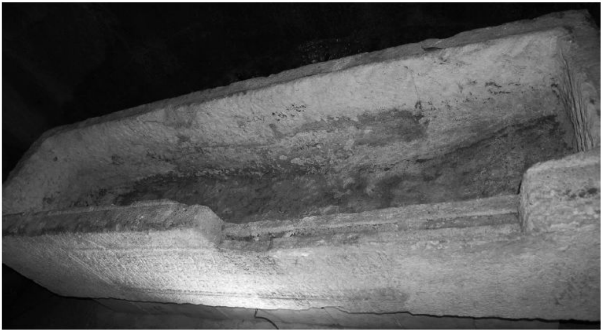
Slika 2. Snimka sarkofaga s vidljivim oštećenjem i žlijebom na rubu