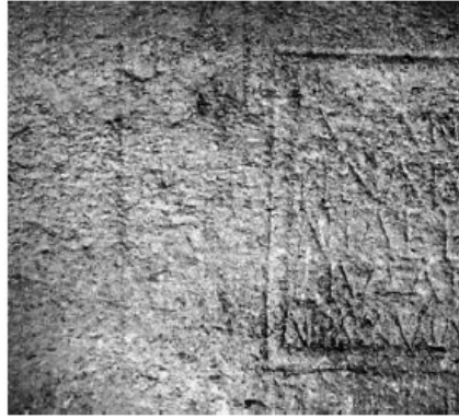
Slika 4. Vidljivi tragovi prerade sarkofaga