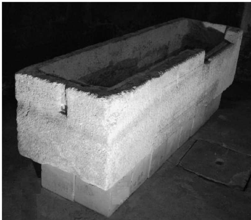
Slika 3. Bočna strana sarkofaga s vidljivim utorom za učvršćivanje sanduka i poklopca