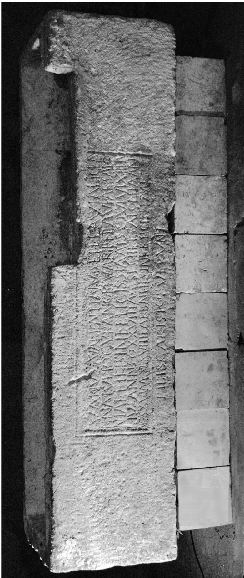
Slika 1. Sarkofag Julija Kirana i Varije Flavije Salonije