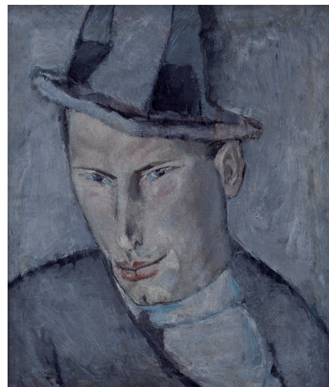
Slika 10 Marino Tartaglia, Portret Mate Meneghella Rodića , 1919. ulje na platnu, 33 × 28 cm, Galerija umjetnina Split, inv. br. 723