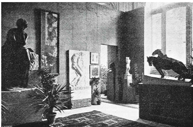
Slika 5 Postav izložbe u paviljonu Kraljevine Srbije, Međunarodna izložba, Rim, 1911.