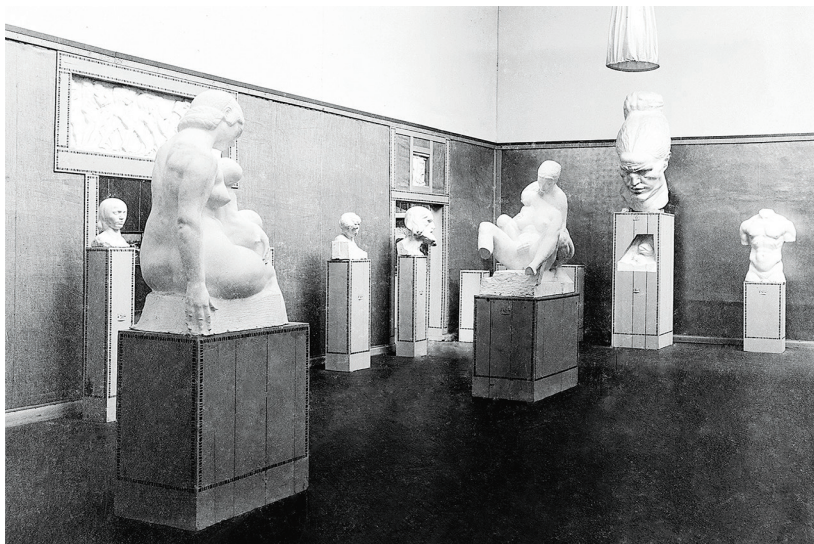
Slika 3 Postav samostalne izložbe Ivana Meštrovića, XXXV. izložba Secesije u Beču, 1910. Fototeka Galerije Meštrović, Split, FGM-1032