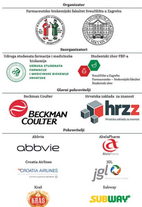
Slika 6. Organizatori i pokrovitelji FARMEBS-a 2017

Da bi skup bio besplatan za sve studente koji su sudjelovali, uloga pokrovitelja je bila neprocjenjiva neovisno o kojem obliku pokroviteljstva se radilo. Organizatori su zahvalni svima (slika 6.).