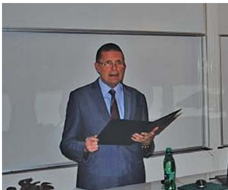
Slika 1. Uvodno izlaganje dekana FBF-a, prof. dr. sc. Ž. Maleša

Dana 27. svibnja 2017. na Farmaceutsko-biokemijskom fakultetu (FBF) Sveučilišta u Zagrebu održan je 6. simpozij studenata farmacije i medicinske biokemije (FARMEBS 2017). Skup je organizirao FBF Sveučilišta u Zagrebu u suradnji sa Studentskim zborom i Hrvatskom udrugom studenata farmacije i medicinske biokemije. Ovaj već tradicionalni skup je platforma za razmjenu iskustava, znanja i rezultata koje su studenti stekli sudjelujući u znanstveno-istraživačkim projektima Fakulteta te u izradi svojih doktorskih, rektorskih i diplomskih radova. Skup je otvorio dekan FBF-a prof. dr. sc. Željani Maleš (slika 1.).