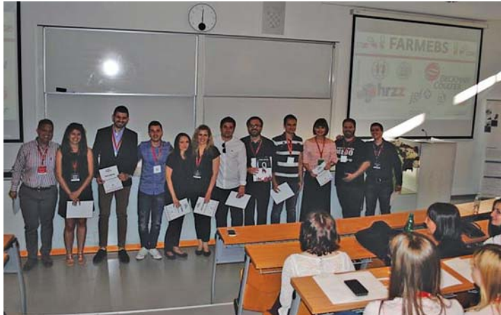
Slika 5. Dio organizacijskog odbora tijekom zatvaranja FARMEBS-a 2017

Da bi skup bio besplatan za sve studente koji su sudjelovali, uloga pokrovitelja je bila neprocjenjiva neovisno o kojem obliku pokroviteljstva se radilo. Organizatori su zahvalni svima (slika 6.).