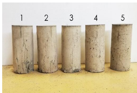
Slika 2. a) \sigma - \varepsilon krivulje za normalan beton bez gume (RNC-0-500) i normalan beton sa 10%, 20%, 30% i 40% GG; b) Ispitani betonski valjci