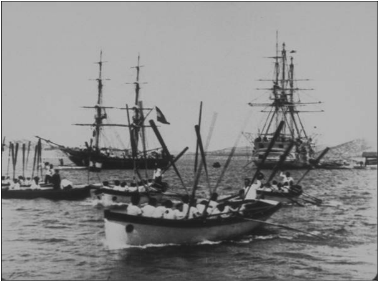
REGATE (RETOUR), (NO 841), ALEXANDRE PROMIO, ŠIBENIK, 28. ILI 29. TRAVNJA 1898. COPYRIGHT ASSOTIATION FRÈRES LUMIÈRE

Prikazivanje: Film je prikazan 12. lipnja 1898. u Lyonu. Podaci o ranijoj bečkoj projekciji nisu istraženi.