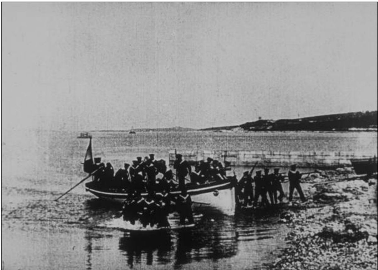
DÉBRQUEMENT ET FEU DE MOUSQUETERIE (No 839), ALEXANDRE PROMIO, PULA, 28. ILI 29. TRAVNJA 1898. COPYRIGHT ASSOCIATION FRÈRES LUMIÈRE

Prikazivanje: Film je prikazan 3. srpnja 1898. u Lyonu. Podaci o ranijoj bečkoj projekciji nisu istraženi.