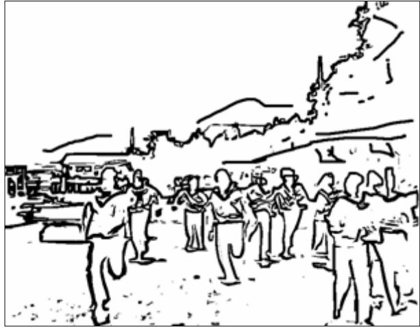
TRKA MORNARA - CRTEŽ

Sadržaj: Prostor mornaričke baze. Uređena kamena obala. S lijeve strane komadić mora i nekoliko čamaca vezanih uz obalu. S desne strane platoa niska kamena kuća iznad koje je drveće. U dubini niska građevina, nad njom drveće a iza veće kameno brdo. Pred tom građevinom stoji velika grupa mornara u bijelim bluzama, tamnim hlačama i s tamnim kapama. Na sredini platoa manji i niski kameni zidić koji možda predstavlja kružni vrt s niskim raslinjem. Iz udaljene grupe mornara izdvaja se grupa od deset koja trčeći ide prema kameru. Pet prolazi pored lijeve, a pet pored desne strane "kružnog toka". Ukupno protrči šest grupa, a časnici ostaju sami u pozadini.