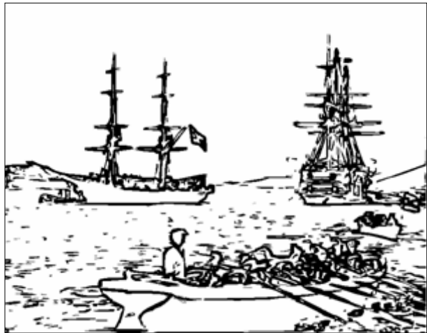
REGATA (PROLAZAK) - CRTEŽ

Sadržaj: Utrka čamaca. Uža lokacija snimanja ista kao i u filmovima 837. i 838, ali s bitno promijenjenom pozicijom kamere. Na moru u drugom planu brik iz filma 837. i 838. Uz pramac brika, koji je postavljen s pramcem ulijevo, vezan je čamac s mornarima. Na desnoj strani kadra je bojni brod - fregata ili korveta s tri jarbola. Vidi se s krmene strane