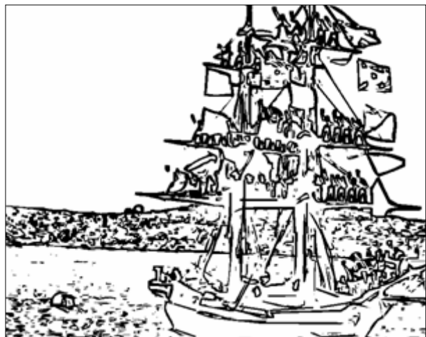
POZDRAV S JARBOLA - CRTEŽ

Gledam pristigli film Salut dans les vergues na prijenosnom računalu. Elektronička inačica je u niskoj rezoluciji ali dovoljno dobra za analizu i za crtež koji radim prema elektroničkoj slici. Film je uzbudljiv, u jednom je kadru i traje 44 s. Brod naše ratne mornarice, valjda kurirski. Brik 14 jedrenjak s dva jarbola (križnjak) vjerojatno iz sredine 19. stoljeća, koji je na oba jarbola razapinjao križna jedra, a