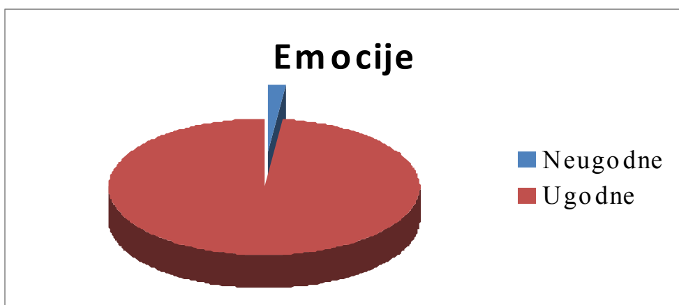
Graf 1: Odnos ugodnih i neugodnih emocija

Iz Tablice 1 i Grafa 1 može se uočiti kako su tijekom Konferencije prevladavale ugodne emocije koje su sudionici dodatno pojasnili različitim komentarima koji su se većinom odnosili na organizaciju Konferencije, ozračje koje je vladalo među sudionicima i mogućnost aktivnoga sudjelovanja (Tablica 2).