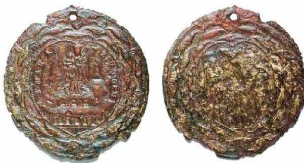
Slika 7 – medaljica iz Oethingena

Oethingen, još i danas omiljeno bavarsko hodočasničko mjesto (2006. godine posjetio ga je i Papa, a naziva se još i srcem Bavorske (Altötting – Herz Bayerns), potrebno je razlikovati od češkog hodočasničkog mjesta Ethingena. Na medaljici je na aversu prikaz Bogorodice s malim Isusom u desnom naručju i žezlom u lijevom, iznad svetišta, te natpis S MARIA OETHINGEN. Na reversu je prikaz sv. Trojstva i štit sv. Benedikta s većinom slova prepoznatljivom za uobičajeni natpis štita. Ova medaljica je sekundarno bušena, sugerira dužu uporabu. (slika 7)