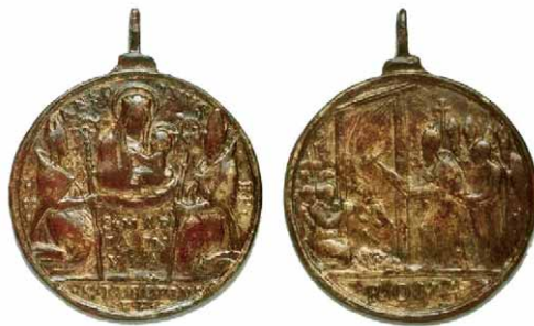
Slika 1 – medaljica s uspomenom na Jubilej u Rimu 1650. godine

od ostalih. Osim ove, u njemu su još dvije medaljice – jedna s prikazom sv. Ignacija i sv. Franje Ksaverskog, a druga s prikazom sv. Ivana Nepomuka i na aversu i na reversu. Na aversu je prikazan, zajedno s Bogorodicom u zvonolikom plaštu, gdje stoji ispred Karlova mosta, a na reversu je klasičan prikaz sv. Ivana Nepomuka s raspelom i palminom granom te karakterističnom isusovačkom kapom.