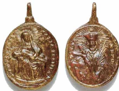
Slika 5 – medaljica iz Mariascheina