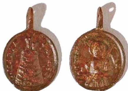
Slika 6 – medaljica iz Loreta

Loreto predstavlja medaljica s prikazom sv. Marije Loretske u zvonolikom plaštu s djetetom Isusom u naručju i natpisom S MARIA LAVRET na aversu, dok je na reversu prikaz sv. Venancija mučenika koji drži stijeg, a odjeven je kao rimski vojnik. Natpis glasi: S VEN M (slika 6).