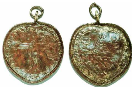
Slika 2 – srolika medaljica iz Pollinga/ Achberga

medvjed je često simbol kršćanstva koje je definirala i obnovila poganske narode 4 (GRUPA AUTORA, 1985: 400). Polling je mjesto u Gornjoj Bavarskoj s tisućljetnom tradicijom štovanja sv. Križa. Prema legendi, u 8. st. nađena su tri čudotvorna križa od kojih jedan i danas postoji na glavnom oltaru bazilike sv. Salvatora (ispitivanja su potvrdila da starost drva jele, drva od kojeg je sačuvani križ načinjen, odgovara legendi). Na reversu je prikaz Bogorodice u zvonolikom plaštu koja lebdi na oblaku, ispod koje je prikaz grada s pravilnim rasterom ulica i tornjem crkve, te dijelom čitljiv natpis: S MARIA ACHBURGENSIS (slika 2).