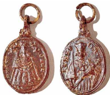
Slika 3 – medaljica iz Mariazella

Medaljice iz Mariazella uglavnom su imale jednak prikaz (slika 3). Na aversu je uvijek prikazana Bogorodica u zvonolikom plaštu s Djetetom obično u desnoj ruci, kako stoji na oblaku, a krune ju dva anđela. Natpis je uobičajen: S MARIA CELL (od 18. stoljeća S MARIA ZELL). Na reversu je ponajviše sv. Obitelj ili sv. Ivan Nepomuk s natpisom S I NEPOM.