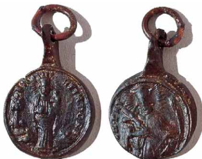
Slika 4 – medaljica iz Heindorfa

Ostale hodočasniče medaljice dolaze samo jednom. Heindorf, češko mjesto Hejnice, smješteno na planini Isergebirge, naziva se i češki Marizell, omiljeno je hodočasničko mjesto Poljaka, Nijemaca i Čeha. Godine 1691. izgrađen je franjevački samostan za potrebe hodočasnika, a 1725. g. posvećena je katedrala u koju se moglo smjestiti tisuću hodočasnika kipa crne smiješeće Madone. Medaljica na aversu ima prikaz Bogorodice s Djetetom u naručju, ispred proplanka na kojem je drvo i grm te natpis: S M HEINDORF. Na reversu je sv. Ivan Nepomuk s raspelom i palmom u rukama te natpis: I N PAT (slika 4).