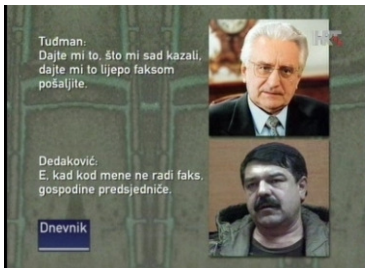
Slika 3: Dnevnikov prikaz razgovora Dedakovića i Tuđmana o pomoći Vukovaru

Ovaj dio priloga započinje sugestivnom rečenicom autora priloga da su molbe za pomoć slane do posljednjeg dana, a zatim se pušta dio razgovora Tuđmana i Dedakovića. Iz ovako montirane snimke/transkripta ispada: