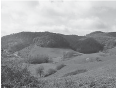
Pozicija tvrdoga grada Blagaja na malenom uzvišenju posred doline

polazne točke Osmanlija na njihovim prodorima kroz dolinu Sane prema Uni i dalje u Slavoniju i slovenske zemlje. 60