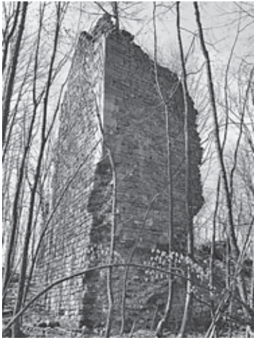
Ostaci romaničke branič-kule tvrđoga grada Blagaja