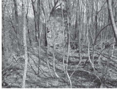
Ostaci palasa tvrđoga grada Blagaja

kojih je sačuvana samo ona u prizemlju. Štoviše, Bojanovski pretpostavlja da je na vrhu kule bio erker oslonjen na drvene konzole, od kojih je prepoznao samo dva ležišta. Očito je blagajska branič-kula zidana za obranu i borbu hladnim oružjem, dakle svakako prije kraja 14. stoljeća. 14