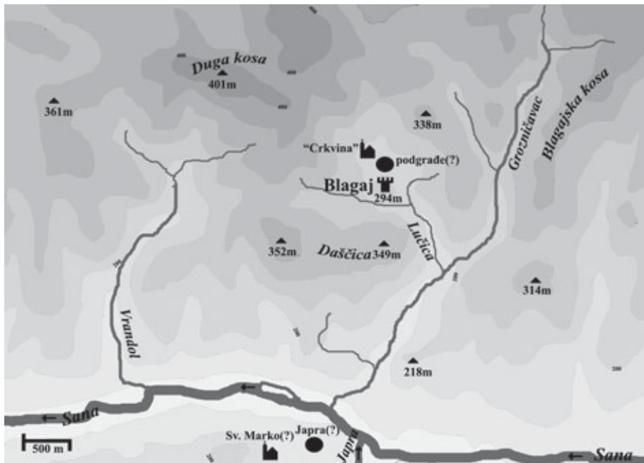
Mikropozicija Blagaja u razvijenom i kasnom srednjem vijeku

lim sufiksom i spada u red vrlo starih toponima poput Oglaja, Bilaja, Maglaja ili Dubočaja. 9