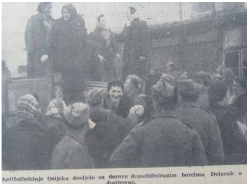
Prilog 4 Antifašistkinje Osijeka u Josipovcu, Glas Slavonije, studeni, 1945.