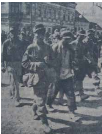
Prilog 1 „Übermenschi prolaze Slavonijom“, Glas Slavonije , lipanj, 1945.