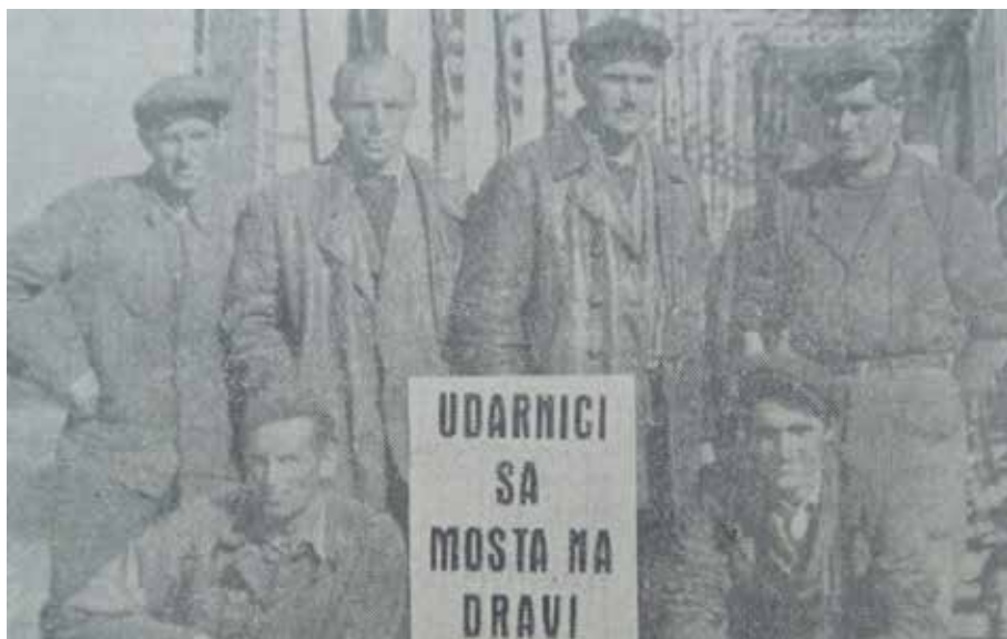
Prilog 3 Radnici na osjeckom željeznikom mostu, Glas Slavonije, listopad, 1946.