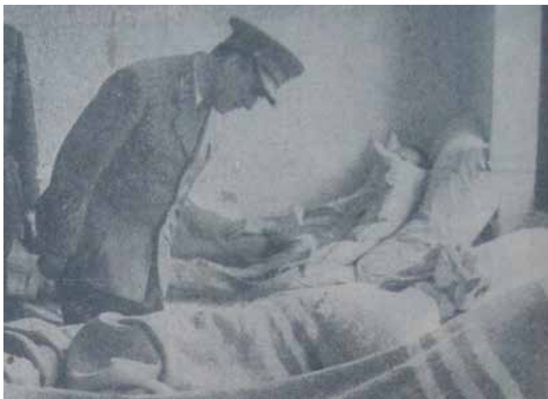
Prilog 5 Tito obilazi ranjenike u Osijeku, Glas Slavonije, lipanj, 1946.